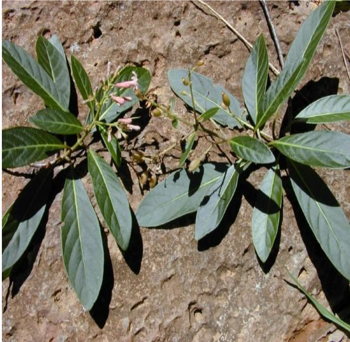
Cinchona off. L. – Quina