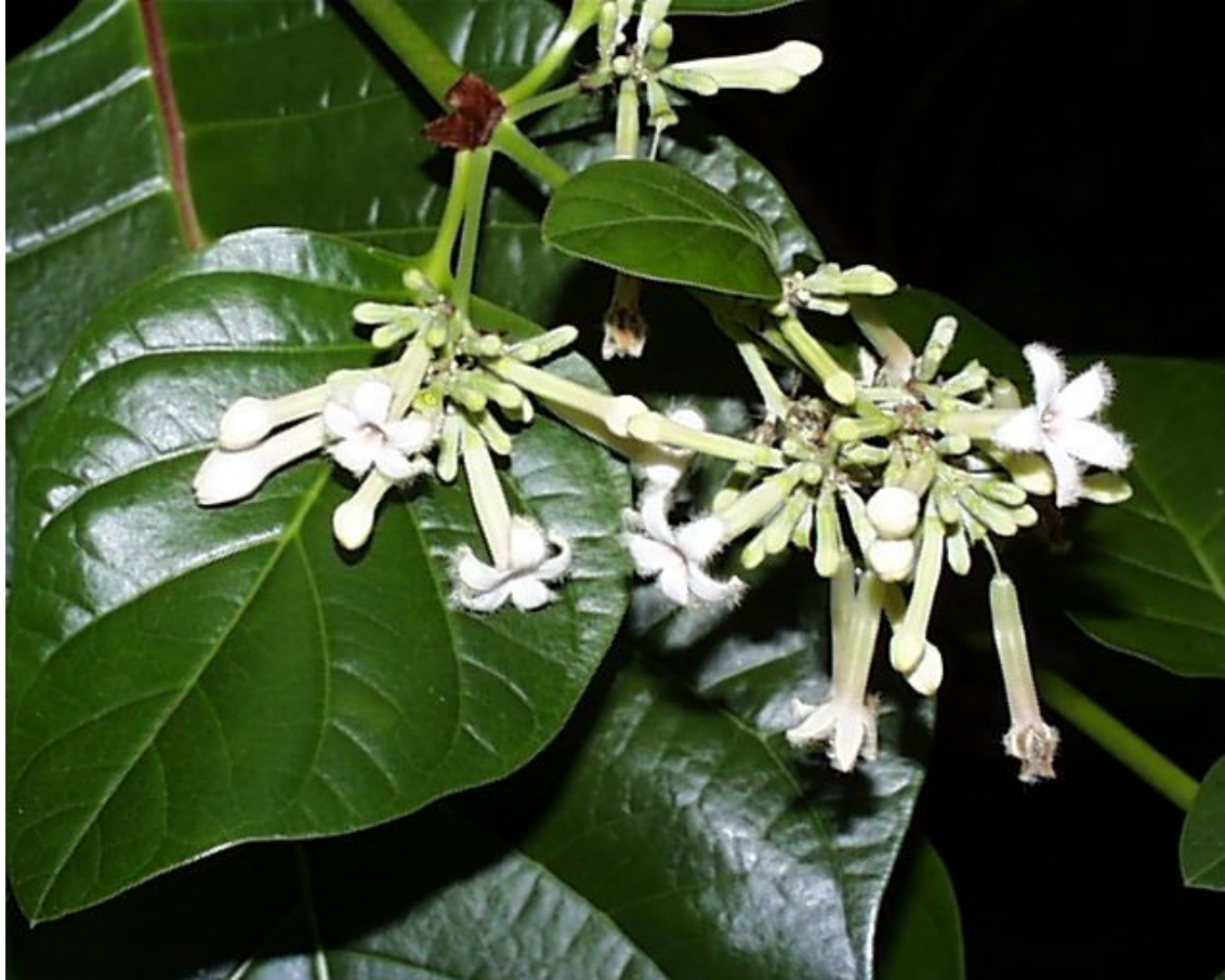
Cinchona pubescens - Quina mineira