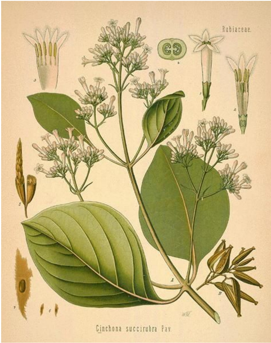
Cinchona succirubra Pav